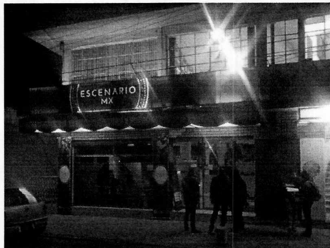
Fotografía 1. Fachada del establecimiento objeto de denuncia.

En este sentido, personal de esta Subprocuraduría llevó a cabo un estudio de emisiones sonoras desde el punto de referencia, durante el cual se constató que el ruido proveniente de la reproducción de música grabada del interior del establecimiento motivo de denuncia constituía una fuente emisora, que en las condiciones de operación presentes durante la visita en que se practicó la medición acústica, generaba un nivel sonoro de 77.53 dB(A), el cual excedía el límite máximo permisible de 62 decibeles especificado en la Norma Ambiental NADF-005-AMBT-2013.