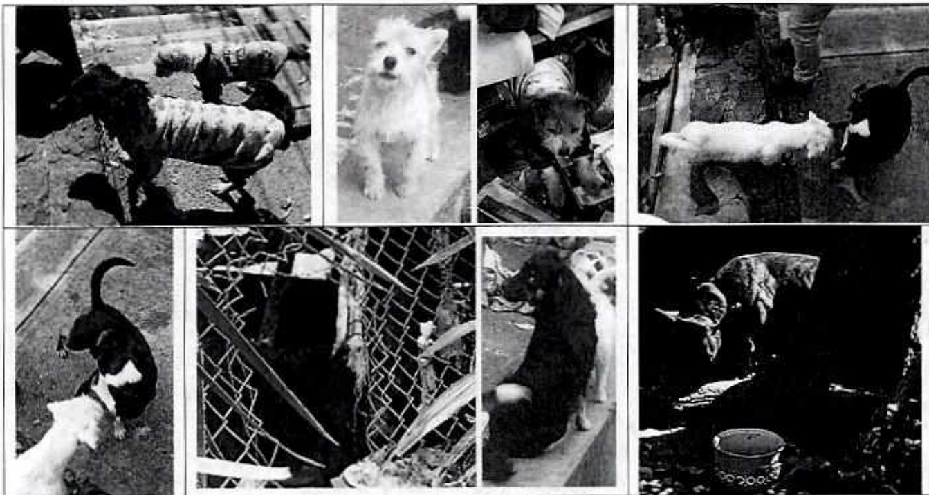
Ejemplares caninos objeto de denuncia.

Asimismo, la responsable de los caninos manifestó que empezó a limpiar pero los vecinos y transeúntes arrojan más basura, por lo que se le hizo hincapié en que la higiene puede afectar la salud de los caninos y de los habitantes del domicilio, a lo que añadió que quizá colocarían una barda para evitar que siguieran lanzando basura y que continuarían limpiando.