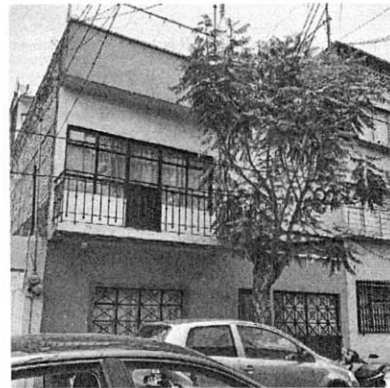
Reconocimiento de hechos realizado por personal adscrito a esta Subprocuraduría en fecha 24 de mayo de 2022

Lo anterior se robustece con lo informado por la Dirección de Verificación de Conexiones en Alcaldías del Sistema de Aguas de la Ciudad de México con número de oficio GCDMX-SECMEX-CG-DGSU-DVCA-26055/DGSU/2022, Dirección que a solicitud de esta entidad, realizó visita de inspección en el inmueble de mérito, de la cual se levantó el Acta Circunstanciada y anexo fotográfico respectivo en fecha 29 de agosto de 2022, diligencia durante la cual se describe lo siguiente: "(...) en el interior del predio se observa un taller de maquilado de piezas de metal (torneado) el aceite que utiliza en su proceso tiende a irse al drenaje de la casa (...)", por lo que en dicha inspección se identificó la operación del taller en el interior del inmueble objeto de denuncia.-----