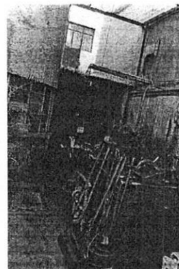
Taller de fabricación de piezas metálicas al interior del inmueble ubicado en Calle 32 A número 13, Colonia Santa Rosa, Alcaldía Gustavo A. Madero.