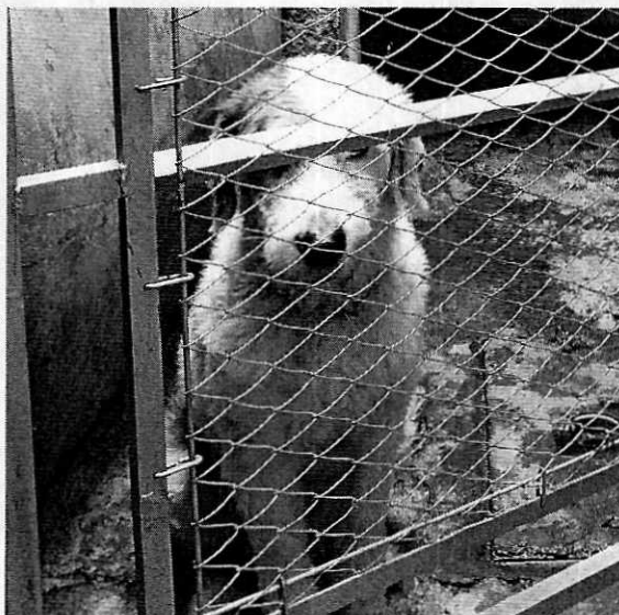
Ejemplar canino motivo de denuncia.