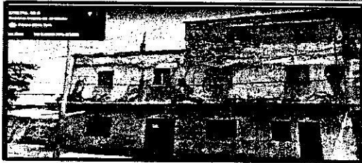
Google Maps- Street View, Abril 2015