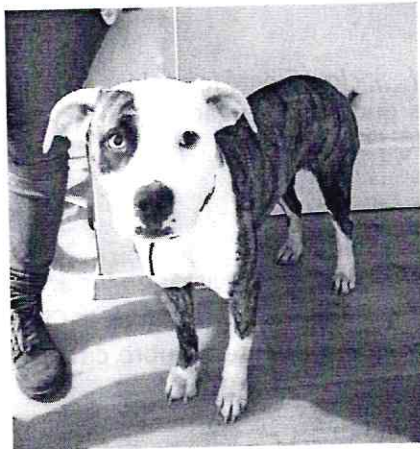
Imagen 1. Ejemplar canino motivo de denuncia visto de frente.

En este sentido, personal de esta Subprocuraduría realizó un reconocimiento de hechos de acuerdo a lo establecido en el artículo 15 BIS 4 fracción IV de la Ley Orgánica de esta Entidad, en el cual se constató la existencia de un ejemplar canino, hembra de 1 año, de raza pitbull, de color café con blanco, de talla grande, tiene una condición corporal ideal, vive dentro del inmueble, es alimentado con croquetas dos veces al día, cuenta con un recipiente de agua limpia a libre acceso y su comportamiento es responsivo sin muestras de estrés.