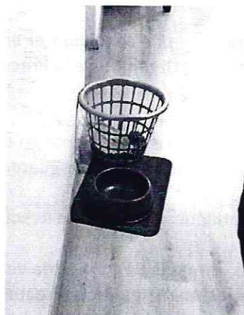
Imagen 4. Lugar de reguardo vista lateral.

En virtud de lo antes expuesto, esta Entidad considera procedente emitir la presente resolución, de conformidad con el artículo 27 fracción VI de la Ley Orgánica de esta Procuraduría, por imposibilidad legal, al no constatar irregularidades en materia de bienestar animal.