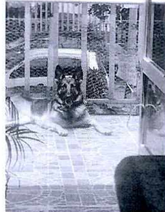
Fotografía. Vista de los caninos evaluados

Con base en lo antes citado, esta Entidad considera que una vez que se dio atención a la presente denuncia por parte del personal adscrito a esta Subprocuraduría, se está en aptitud de emitir la resolución administrativa que conforme a derecho proceda, esto de acuerdo con la fracción VI del artículo 27 de la Ley Orgánica de la Procuraduría Ambiental y del Ordenamiento Territorial de la Ciudad de México, por imposibilidad legal, al no constatar irregularidades en materia de bienestar animal.