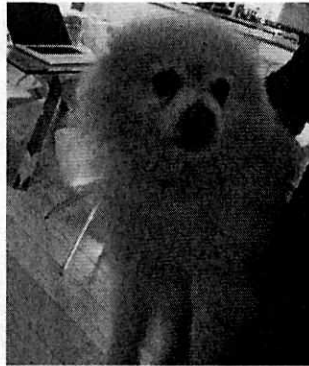
Se muestra al ejemplar canino motivo de denuncia.

Expediente: PAOT-2019-4700-SPA-2978 No. de Folio: PAOT-05-300/200- 2873 -2020