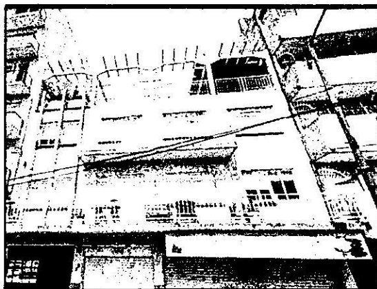
Google Maps- Street View, marzo 2021

A mayor abundamiento, personal adscrito a esta Subprocuraduría, de conformidad con los artículos 21 y 25 fracción VIII de la Ley Orgánica de esta Entidad, y 56 antepenúltimo párrafo de la Ley de Procedimiento Administrativo de la Ciudad de México, de aplicación supletoria, a efecto de allegarse y desahogar todo tipo de elementos probatorios para el mejor conocimiento de los hechos sin más limitantes que las señaladas en la Ley de Procedimiento Administrativo de la Ciudad de México, siendo que en los procedimientos administrativos se admitirán toda clase de pruebas, excepto la confesional a cargo de la autoridad y las que sean contrarias a la moral, al derecho o las buenas costumbres; en fecha 13 de mayo 2023, realizó la consulta al Sistema de Información Geográfica Google Maps, vía Internet ( https://www.google.com.mx/maps/preview ), y con ayuda de la herramienta Street View, en la cual se localizaron imágenes a pie de calle del inmueble en el año 2021 y 2022, no se advierten ampliaciones o modificaciones.