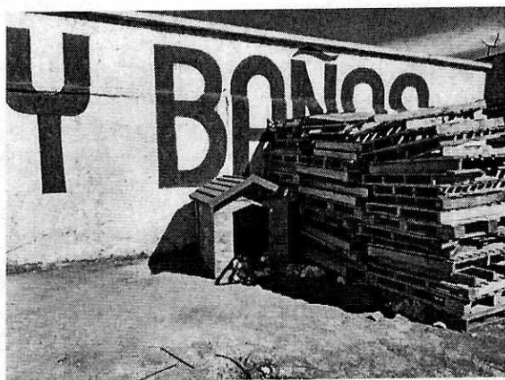
Fotografía 3. Casa del canino.