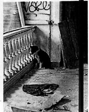
Fotografía 1-4. Ejemplares caninos motivo de denuncia.

Medellín 202, piso 4, colonia Roma Norte alcaldía Cuauhtémoc, C.P. 06700, Ciudad de México Tel. 5265 0780 ext 12011 y 12400