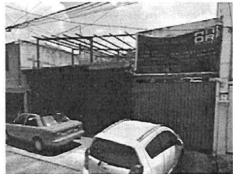
GOOGLE MAPS AGOSTO 2022

En este sentido, esta Subprocuraduría emitió oficio dirigido al Propietario, Poseedor y/o Director Responsable de Obra del inmueble investigado, a efecto de que realizara las manifestaciones que conforme a derecho corresponden y presentara las documentales que acreditaran la legalidad de los trabajos de obra. Al respecto, mediante correo electrónico recibido en esta Subprocuraduría en fecha 08 de septiembre de 2022, dos personas quienes se ostentaron como propietaria y responsable del predio, realizaron diversas manifestaciones, dentro de las cuales se encuentra las siguientes: -----