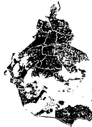
Imagen 2. Zonificación del sitio denunciado conforme al PGOE, vigente.

Imagen QuickBird, 2008, con sobreposición del PGOE de la Ciudad de México, vigente.