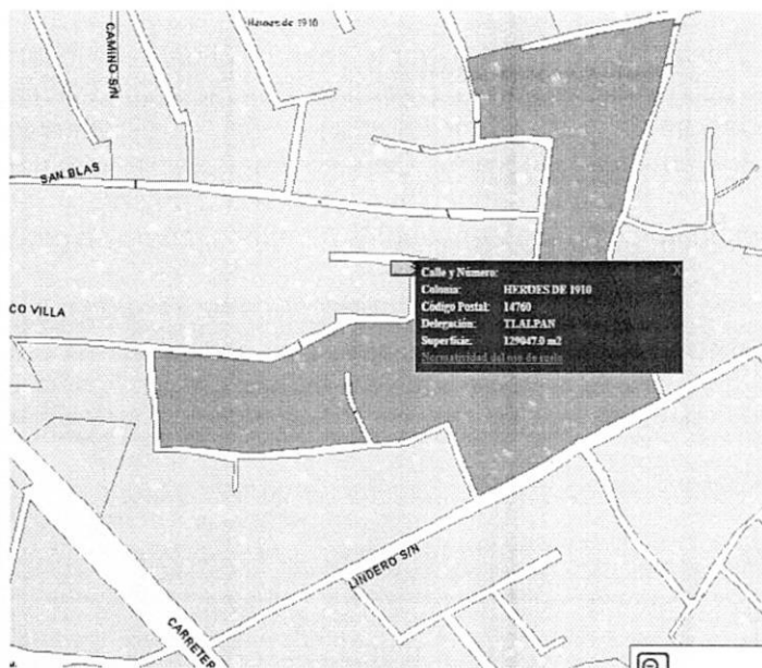
Imagen obtenida del SIG-CiudadMX de SEDUVI de poligonal de catastro del polígono correspondiente al sitio objeto de denuncia.

Adicionalmente a lo anterior, personal de esta Entidad visualizó la versión digital simplificada del Inventario de Asentamientos Humanos Irregulares, consultada en el SIG-PAOT "Sistema de Información del Patrimonio Ambiental y Urbano de la CDMX", a la cual se sobrepone la poligonal del sitio objeto de denuncia, situándose en el asentamiento registrado como Camino al Xicotntle / Lomas de Tepemecac.--