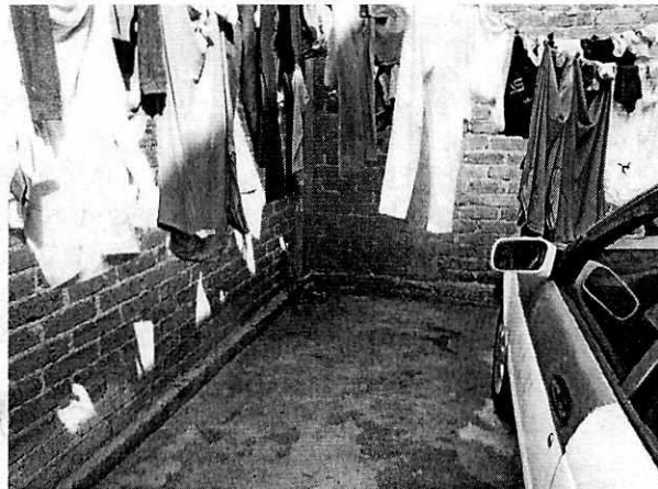
Fotografía 4. Sin presencia del ejemplar canino.

En seguimiento a la denuncia, personal de esta Subprocuraduría continuó la investigación correspondiente y se realizó una sexta visita de reconocimiento de hechos el día 17 de diciembre del dos mil diecinueve en la que el propietario refirió, que al dejar la puerta de acceso abierta el ejemplar salió corriendo, realizaron su búsqueda, sin embargo dicho ejemplar no fue encontrado.