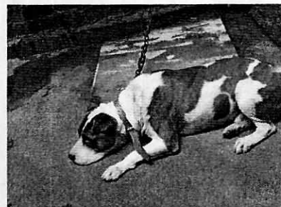
Fotografía 1,2 y 3. Ejemplar canino motivo de denuncia.