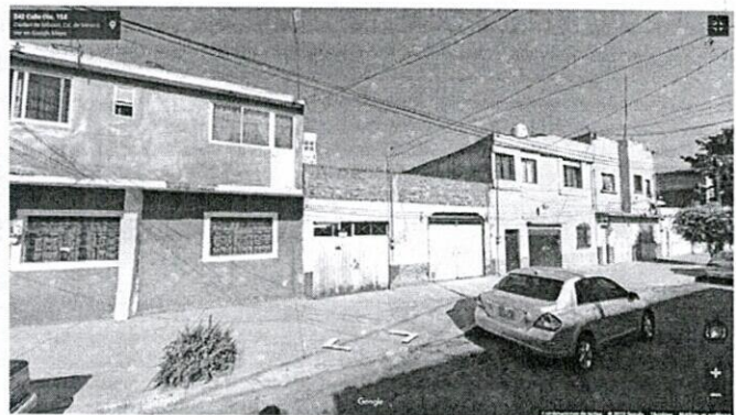
Google Maps-Street View: enero 2023

No obstante, para efectos de mejor proveer, mediante oficio PAOT-05-300/300-04762-2023, notificado en fecha 03 de julio de 2023, al propietario, poseedor, encargado y/o director responsable de la obra ubicada en el predio de mérito, esta Subprocuraduría solicitó al mismo realizar las manifestaciones que