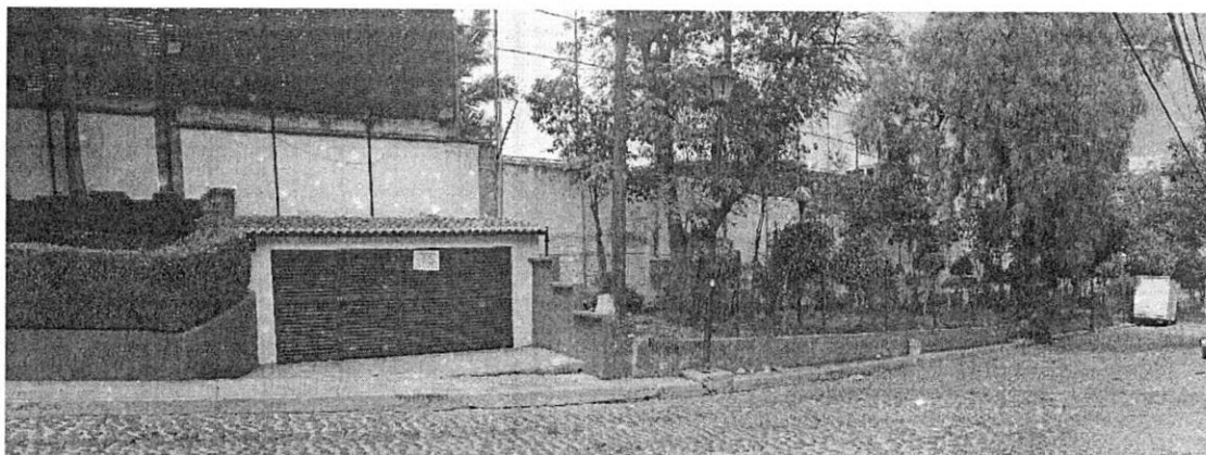
Imagen 3. Aun continua en pie del cuerpo constructivo en pie.

En ese sentido, el artículo 22 BIS 2 de la Ley Orgánica de la Procuraduría Ambiental y del Ordenamiento Territorial de la Ciudad de México, establece que la denuncia sólo podrá presentarse dentro del plazo de un año, a partir de que se hubiera iniciado la ejecución de los actos, hechos u omisiones referidos en el artículo 22, o de que el denunciante hubiese tenido conocimiento de los mismos. -----