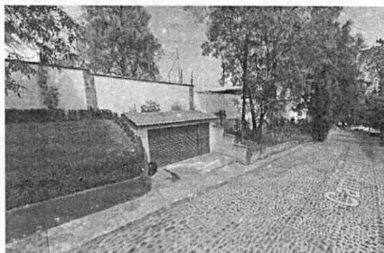
Imagen 1. Se observa el cuerpo constructivo de un nivel.