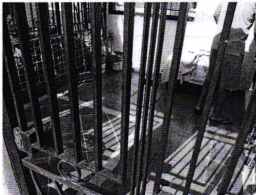
Fotografía 2. Vista del patio del inmueble referido en el escrito de denuncia.

animal de compañía que responde al nombre de "Titán", se llevó a cabo la limpieza del sitio, observándose limpio, sin heces u orina, asimismo le fue proporcionado un recipiente metálico con agua limpia a su libre disposición.