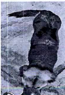
Imagen 1. Canino hembra llamado "Kaily"