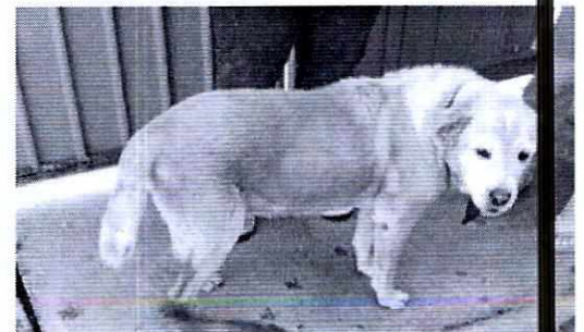
Imagen 3. Canino Hembra llamado "Costeña"