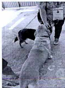
Imagen 2. Interacción de los caninos motivos de la denuncia con el personal de la procuraduría