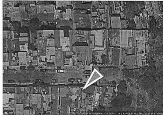
Puerta de acceso y punto de toma de fotografías.

características de uso habitacional, concluidos y habitados, a base de materiales permanentes y semi-permanentes, sin que se observaran actividades, materiales ni trabajadores de la construcción. Es de mencionar que no se tuvo acceso por la escalinata hacia dichos inmuebles, toda vez que el acceso a estas se encontró cerrado con candado. -----