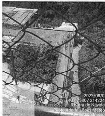
Construcciones desplantadas más allá del final de la calle.

En razón de lo anterior, personal de esta Entidad se comunicó con la persona denunciante con la finalidad de obtener referencias respecto al inmueble denunciado, por lo que dicha persona proporcionó elementos para su ubicación y señaló que la construcción objeto de su denuncia se encuentra al final de la escalinata antes mencionada. -----