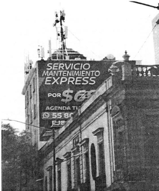
Fuente PAOT: reconocimiento de hechos de fecha 20 de agosto de 2021

Al respecto, durante las visitas de reconocimiento de hechos realizadas por personal adscrito a esta Entidad en fechas 20 de agosto y 19 de octubre de 2021, al inmueble ubicado en Calle Puente de Alvarado número 42, Colonia Tabacalera, Alcaldía Cuauhtémoc, se constató un inmueble de 6 niveles de altura, observando un anuncio adosado al muro ciego del mismo, con publicidad de la marca "Nissan", sin observar letrero con datos del anuncio. -----