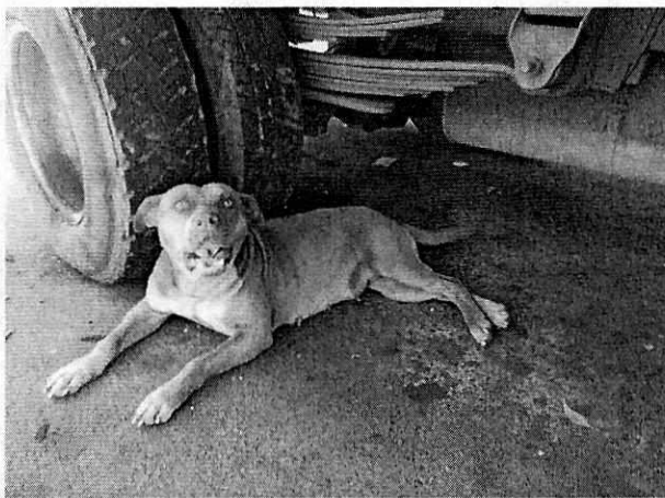
Fotografía 7 y 8. Condiciones de "Chata" en la tercera visita.

En virtud de lo antes expuesto, esta Entidad considera procedente emitir la presente resolución, de conformidad con el artículo 27 fracción VII de la Ley Orgánica de esta Procuraduría, por el cumplimiento voluntario de las disposiciones jurídicas en materia de bienestar animal.