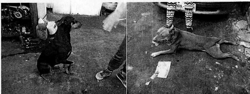
Fotografía 1 y 2. Ejemplares caninos motivo de denuncia.