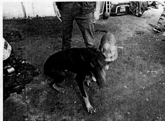
Fotografía 3 y 4. Lugar de alojamiento limpio.

Se realizó una segunda visita de reconocimiento de hechos el día 22 de enero del año dos mil veinte, en el cual se constató que "Roky" sigue presentando todas las condiciones de bienestar animal, sin embargo "Chata", se encontraba atada a una correa de aproximadamente 1 metro de longitud, dicho espacio se encontraba sucio; asimismo se advirtió un recipiente de plástico sin agua limpia a su disposición.