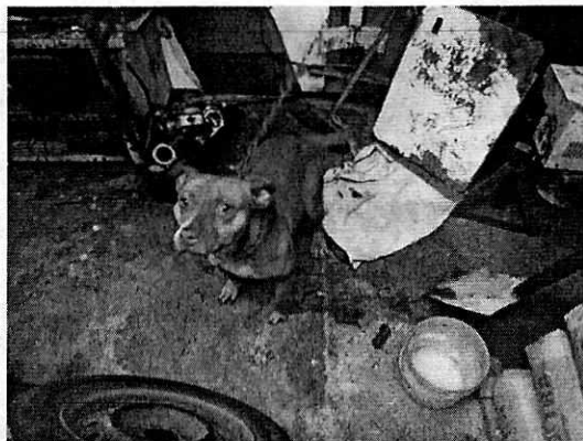
Fotografía 5 y 6. Condiciones de "Chata" en la segunda visita.

En seguimiento a la denuncia, personal de esta Subprocuraduría continuó la investigación correspondiente