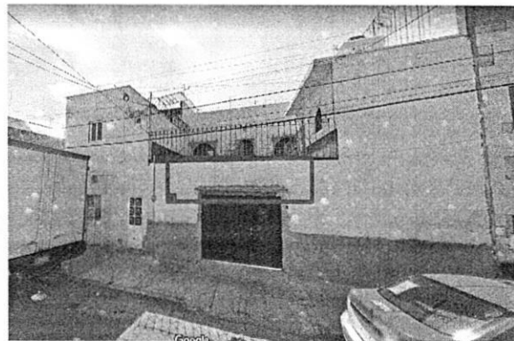
Abril 2022