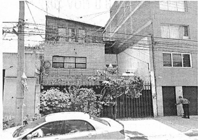
Imagen de fecha agosto de 2019