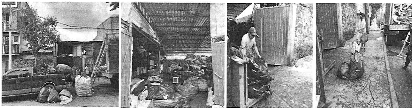
Imágenes: Localización y registro fotográfico de visita de reconocimiento de hechos en el sitio objeto de denuncia.

Por lo anterior, y a efecto de mejor proveer el cumplimiento de la normatividad se notificó el oficio PAOT-05-300/300-4186-2022, dirigido al propietario del establecimiento mediante el cual se le hace de conocimiento la denuncia que por esta vía se atiende, a fin de que la persona responsable del mismo realizara las manifestaciones que considerara procedentes y en su caso aportara el soporte documental que acreditara la legalidad de las actividades que realiza.-----