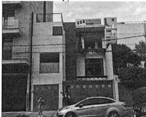
Imagen No. 2 – Se observa el inmueble objeto de investigación se conforma por 3 niveles, donde se hicieron modificaciones en vanos y pintura.