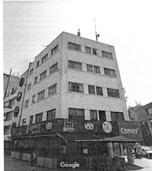
Imagen de fecha de abril de 2021