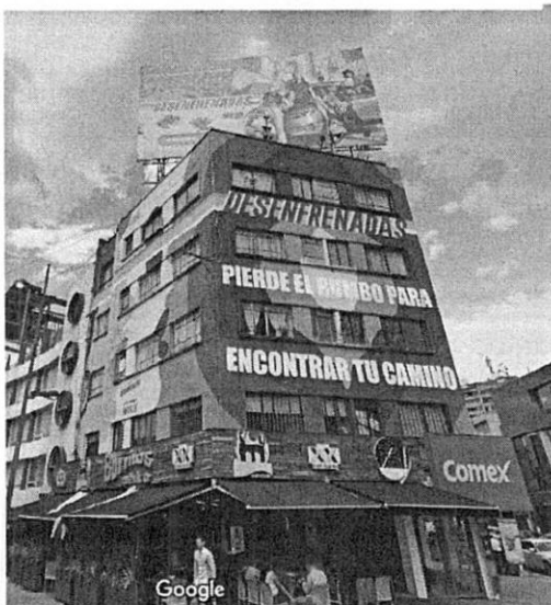
Imagen de fecha de marzo de 2020