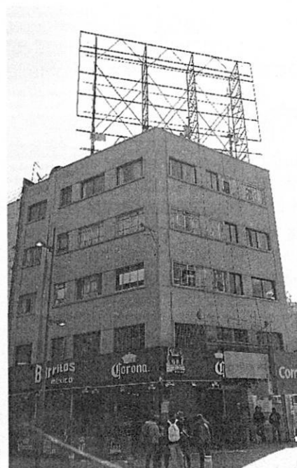
Fuente PAOT: reconocimiento de hechos de fecha 04 de agosto de 2022

En este sentido, mediante oficio PAOT-05-300/300-004965-2021, se exhortó al Propietario, Poseedor, Representante Legal y/o Encargado del inmueble y se le solicitó retirar el anuncio publicitario, o de ser el caso, cumplir con los permisos y/o autorizaciones que le permitan instalar la publicidad exterior en el inmueble objeto de investigación; sin que a la fecha de emisión de la presente aportara las documentales que acrediten la instalación de la publicidad constatada. -----