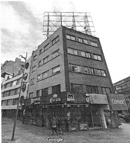
Imagen de fecha de octubre de 2022