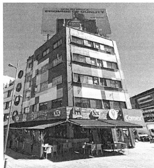
Imagen de fecha de febrero de 2019

Adicionalmente, de la consulta realizada al Padrón Oficial de Anuncios Sujetos al Reordenamiento de la Publicidad Exterior del Distrito Federal (ahora Ciudad de México) publicado en la Gaceta Oficial de la Ciudad de México, el 18 de diciembre de 2015; se localizó 1 registro para el inmueble en cuestión, a nombre de la empresa publicitaria "CASA PUBLICIDAD Y ASOCIADOS S.A DE C.V", con código alfanumérico 11LOOC3J5P", anuncio en azotea con estatus de instalado. -----