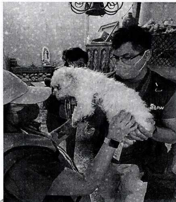
Fotografía 1. Canino objeto de investigación.

Derivado de lo anterior, el responsable realizó la entrega voluntaria del referido animal de compañía, a fin de que recibiera la atención medico veterinaria necesaria, por lo que posteriormente, dicho canino fue entregado a una Asociación Protectora, para su rehabilitación y posterior adopción.