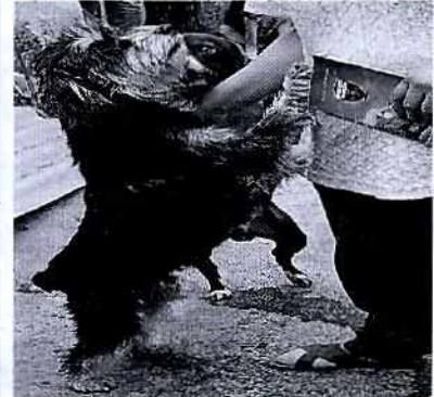
Imágenes de los ejemplares caninos y felino objeto de investigación

No obstante, esta Subprocuraduría mediante el oficio correspondiente hizo del conocimiento de la persona habitante del domicilio referido, las disposiciones vigentes en materia de protección a los animales, conminándola a su debido cumplimiento.