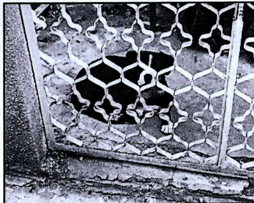
Imagen 2. Ejemplar canino motivo de denuncia libre.

Respecto al alimento, el propietario del ejemplar canino refirió que le proporciona una ración de croquetas y comida casera dos veces al día, así como agua limpia y fresca de manera permanente, lo que fue constatado por el personal actuante en el momento de la visita.