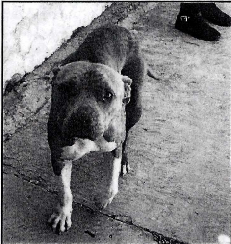
Imagen 3. Ejemplar canino “Solovino”.

En cuanto a su comportamiento, se observó que son sociables, permiten el contacto físico y se muestra dispuestos al juego de manera inmediata; en este sentido derivado del comportamiento mostrado por los ejemplares caninos, se deduce que no presentan signos de estrés o aislamiento.