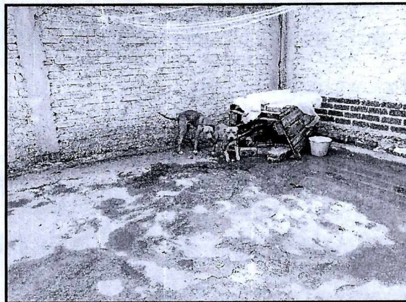
Imagen 2. Sitio de alojamiento de los ejemplares.

Debido a lo anterior durante comparecencia sostenida con la persona propietaria de los ejemplares caninos se exhortó a mejorar el sitio de alojamiento para los dos cánidos, a proporcionarle alimento constantemente a "Solovino" con la finalidad de que recupere peso, a extender la cadena de "Daysi", así como brindarles la atención médica veterinaria necesaria.