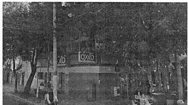
Google Maps Abril 2021