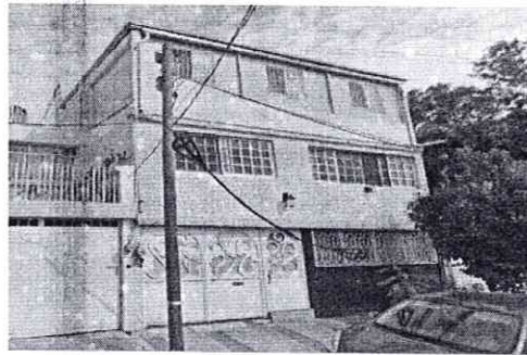
Google Maps Street View – mayo de 2022