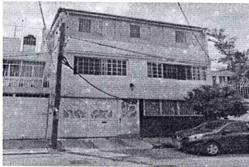
Google Maps Street View – abril de 2021