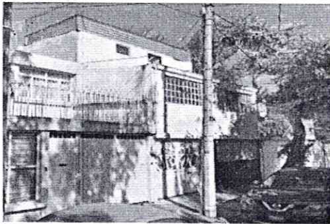
Google Maps Street View – enero de 2017