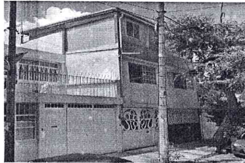
Google Maps Street View – septiembre de 2018