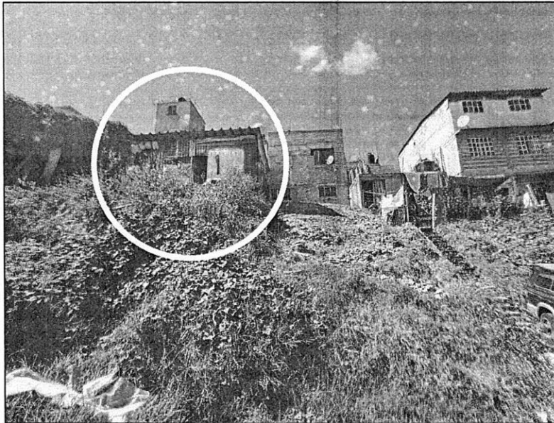
reconocimiento de hechos 08 de noviembre de 2022.

Cabe señalar que, de las imágenes obtenidas mediante la herramienta Street View del programa Google Maps, se observa que en noviembre de 2018, en la parte trasera del predio denunciado, existe una construcción de tipo provisional de un nivel de altura hecha a base de láminas metálicas, de aparentemente de uso habitacional, misma que se constató en el reconocimiento de hechos. -----