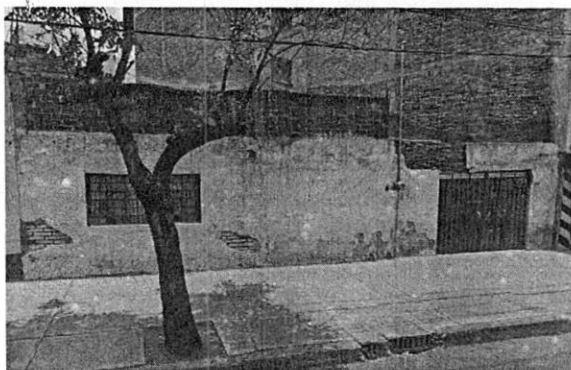
Mayo de 2019

No obstante lo anterior, personal adscrito a esta Subprocuraduría, realizó un estudio multitemporal mediante el uso de la aplicación digital Google Maps y su herramienta Street View, donde se constató que entre las fechas mayo de 2019 y febrero de 2022 al inmueble en cuestión le fueron realizadas modificaciones mayores, así como la ampliación de un nivel y la colocación techumbre en azotea, sin exhibir lona de Registro de Manifestación o los datos de la obra: