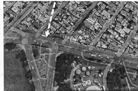
Zonificación asignada al predio denunciado, de conformidad con el Programa Delegacional de Desarrollo Urbano de la Alcaldía Tláhuac 2008.