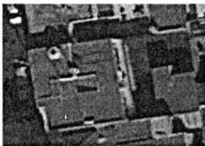
Google Earth: Febrero de 2017.

Respecto a la materia de derribo de arbolado, durante el reconocimiento de hechos se identificó un individuo arbóreo en pie sobre la acera frontal del predio objeto de denuncia sin identificar derribo, asimismo, se realizó una consulta a la herramienta multitemporal de la aplicación digital Google Earth, en la cual, mediante imágenes aéreas de fechas febrero de 2017, marzo de 2018, marzo de 2019, y abril de 2020, a efecto de identificar arbolado en la parte posterior del predio, sin embargo las imágenes presentan limitaciones en cuanto a su resolución, aunado a lo anterior, no fue posible obtener el acceso al interior del inmueble de mérito, toda vez que cuenta con sellos de clausura de actividades. -----