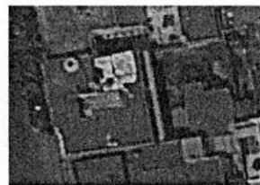
Google Earth: Marzo de 2019.