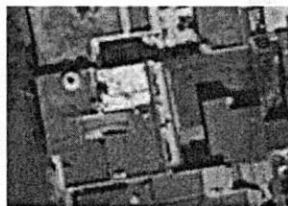
Google Earth: Marzo de 2018.