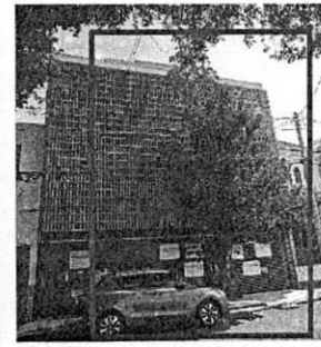
Reconocimiento de hechos: 04 de agosto de 2022

Al respecto, a solicitud de esta Procuraduría, mediante oficio AC/DGSU/DIMEP/0579/2022, la Dirección General de Servicios Urbanos de la Alcaldía Cuauhtémoc, informó que no cuenta con antecedente de trámite relacionado con la autorización para el derribo y/o poda de sujetos arbóreos para el inmueble ubicado en Calle Puerto México número 60, Colonia Roma Sur, Alcaldía Cuauhtémoc. -----