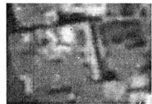
Google Earth: Abril de 2020.

Aunado a lo anterior, personal adscrito a esta Subprocuraduría realizó una consulta en la herramienta multitemporal streetview de la aplicación digital Google Maps, de la cual se identificó un árbol en la acera frontal del inmueble, mediante imágenes de fechas febrero de 2018, julio de 2019 y diciembre de 2021, mismo que se mantiene en pie de conformidad con los reconocimientos de hechos realizados por personal adscrito a esta Subprocuraduría. -----