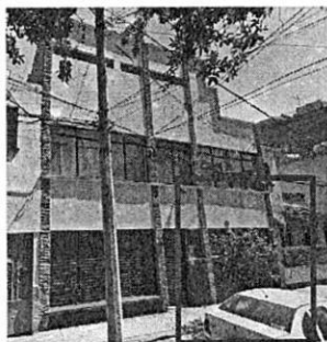
Google Streetview: Febrero de 2018

Aunado a lo anterior, personal adscrito a esta Subprocuraduría realizó una consulta en la herramienta multitemporal streetview de la aplicación digital Google Maps, de la cual se identificó un árbol en la acera frontal del inmueble, mediante imágenes de fechas febrero de 2018, julio de 2019 y diciembre de 2021, mismo que se mantiene en pie de conformidad con los reconocimientos de hechos realizados por personal adscrito a esta Subprocuraduría. -----