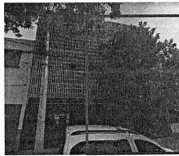
Google Streetview: Diciembre de 2021