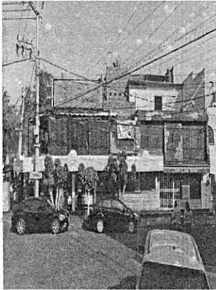
Google StreetView: febrero de 2020