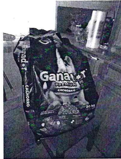
Imagen 4. Bulto de alimento.

En virtud de lo antes expuesto, esta Entidad considera procedente emitir la presente resolución, de conformidad con el artículo 27 fracción VI de la Ley Orgánica de esta Procuraduría, por imposibilidad legal, al no constatar irregularidades en materia de bienestar animal.