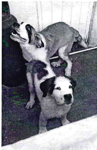
Imagen 1. Ejemplares caninos motivo de denuncia.

En este sentido, personal de esta Subprocuraduría realizó un reconocimiento de hechos de acuerdo a lo establecido en el artículo 15 BIS 4 fracción IV de la Ley Orgánica de esta Entidad, en el cual se constató la existencia de dos ejemplares caninos, un macho de 5 meses que responde al nombre de "Koda" y una hembra de 4 meses que responde al nombre de "Nana", ambos de raza san bernardo, de color blanco con café y negro, de talla extra grande, tienen una condición corporal ideal, viven al interior del departamento salen a paseos diarios de por lo menos una hora, son alimentados tres veces al día con croquetas y comida casera (pollo y arroz), cuentan con recipiente para agua encontrándose limpia y de forma permanente, su actitud es sociable y reaccionan favorablemente al juego, cuentan con atención médica veterinaria, mostrando sus cartillas de vacunación y desparasitación vigentes adecuadas a su edad.