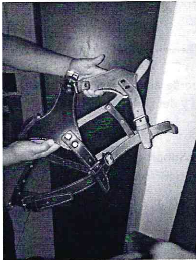
Imagen 3. Pecheras para salir a pasear.