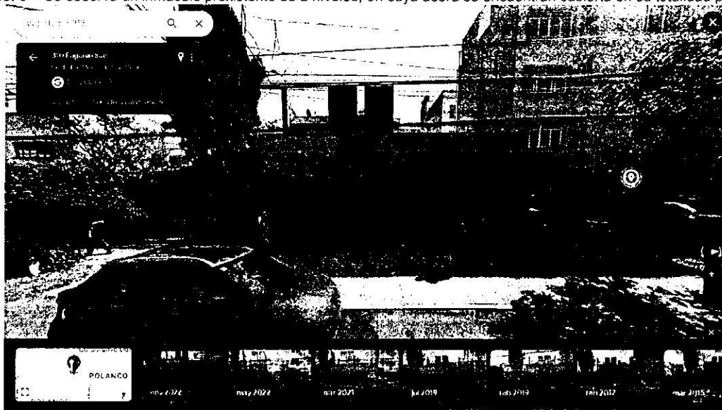
Imagen No. 3 – Se observa un inmueble preexistente de 2 niveles, en cuya acera se encuentran cubierta en su totalidad por concreto.