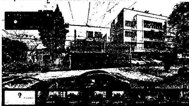
Imagen No. 1 – Se observa un inmueble preexistente de 2 niveles, en cuya acera se encuentra una superficie cubierta con adopasto de aproximadamente 12.00 m 2 .