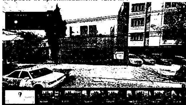
Imagen No. 2 – Se observa un inmueble preexistente de 2 niveles, en cuya acera se encuentra una superficie cubierta con adopasto de aproximadamente 12.00 m 2 .