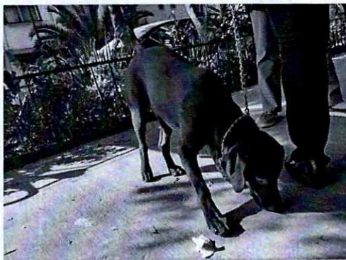
FOTOGRAFÍA.- Vista del ejemplar canino.

Con base en lo antes citado, esta Entidad, considera que una vez que se dio atención a la presente denuncia por parte del personal adscrito a esta Subprocuraduría, se está en aptitud de emitir la resolución administrativa que conforme derecho proceda, esto de acuerdo con la fracción III del artículo 27 de la Ley Orgánica de la Procuraduría Ambiental y del Ordenamiento Territorial de la Ciudad de México.