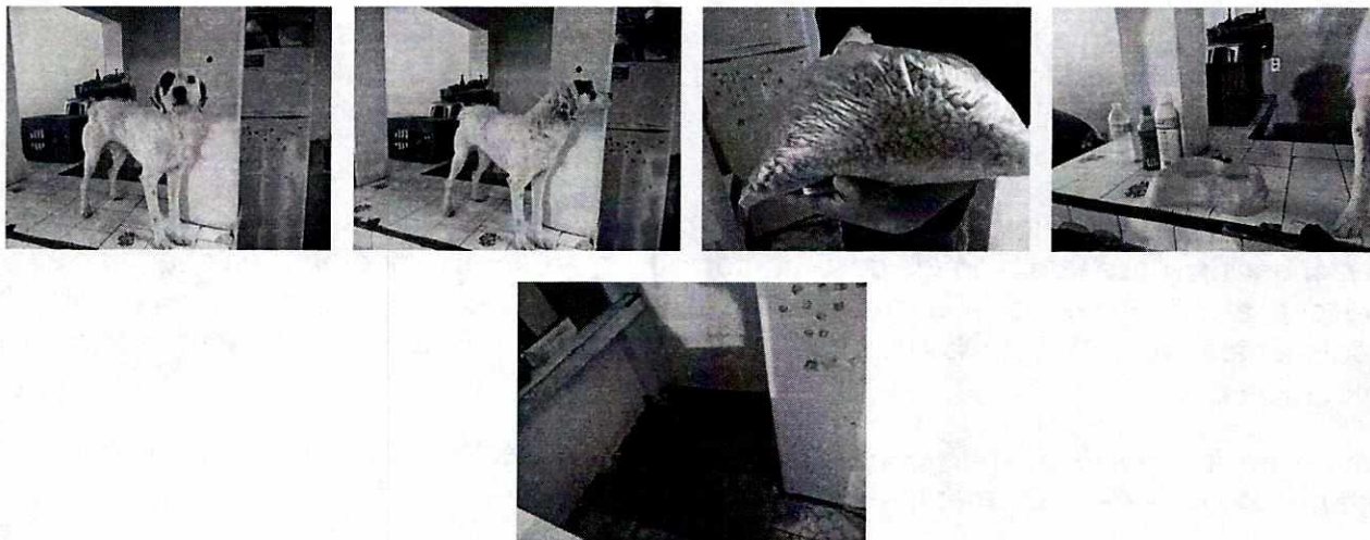
FOTOGRAFÍAS.- Vistas del ejemplar canino que es alojado en el inmueble, así como de las croquetas y el espacio de descanso..