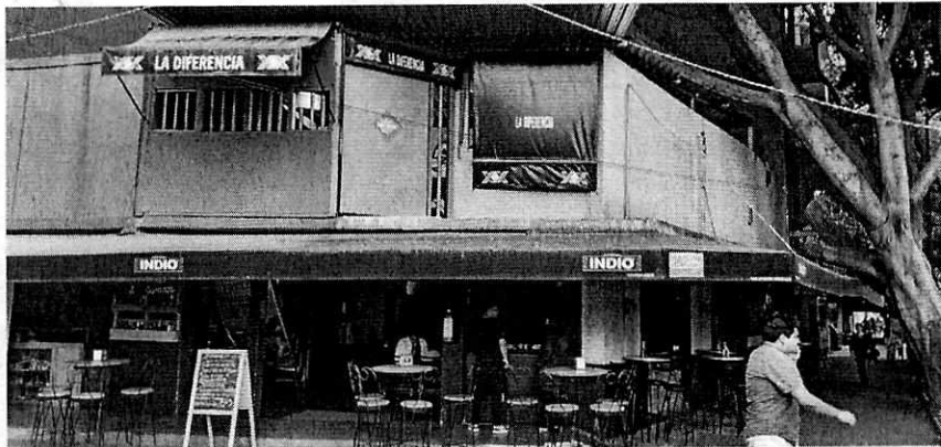
En la imagen se observa el establecimiento comercial denominado "La Diferencia".

Al respecto, el artículo 123 de la Ley Ambiental de Protección a la Tierra en el Distrito Federal, actual Ciudad de México, señala que todas las personas están obligadas a cumplir con los requisitos y límites de emisiones de ruido establecidos en las normas aplicables. Asimismo, el artículo 151 de la citada Ley, señala que se prohíben las emisiones de ruido que rebasen las normas oficiales mexicanas y las normas ambientales del Distrito Federal, actual Ciudad de México.