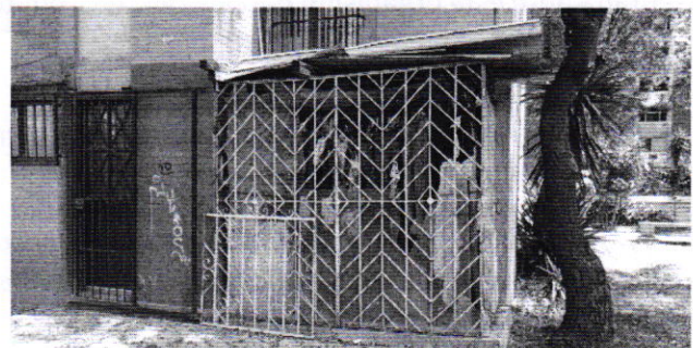
Figuras 1 y 2. Lugar de los hechos denunciados.

En seguimiento de lo anterior, personal de esta Subprocuraduría informó a la persona denunciante que durante visita de reconocimiento de hechos no se constató la presencia del ejemplar canino en el sitio señalado en su denuncia, por lo que los hechos que motivaron su denuncia dejaron de existir.