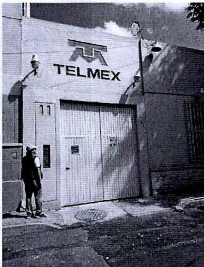
En la imagen se aprecia la central telefónica

En complemento a lo anterior, la norma aplicable en la materia ambiental (emisiones sonoras) es la norma NADF-005-AMBT-2013, que establece las condiciones de medición y los límites máximos permisibles de emisiones sonoras de aquellas actividades o giros que para su funcionamiento utilicen maquinaria, equipo, instrumentos, herramienta, artefactos o instalaciones. Dicha norma establece además, que los límites máximos permisibles de emisiones sonoras de aquellas actividades o giros que para su operación requieran maquinaria y equipo que generen emisiones sonoras al ambiente serán de 63 dB (A) de las 6:00 a las 20:00 horas y de 60 dB (A) de las 20:00 a las 6:00 horas.