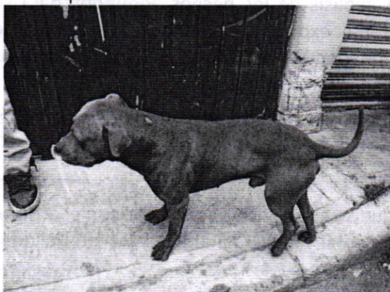
Fotografía 2. Ejemplar canino que responde al nombre de "Canelo"