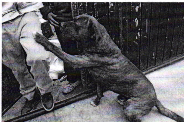
Fotografía 3. Ejemplar canino que responde al nombre de "Canelo"

Por lo antes referido y toda vez que los ejemplares caninos se encontraban en la vía pública, en seguimiento a la denuncia, personal de esta Entidad realizó otra visita de reconocimiento de hechos, durante la cual se constató que derivado del cumplimiento voluntario por parte de la persona propietaria de los animales de compañía, fueron retirados de la vía pública y reubicados al interior de la vivienda de referencia, espacio en el cual deambulan libremente.