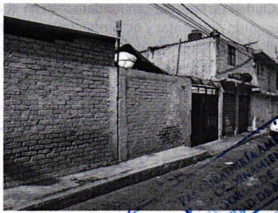
Fotografías 4 y 5. Vista del sitio referido en el escrito de denuncia.