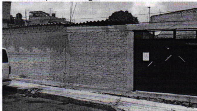
Fotografía 1. Vista del sitio en el cual presuntamente se encontraban los ejemplares caninos motivo de denuncia.

En este sentido, personal de esta Subprocuraduría realizó dos visitas de reconocimiento de hechos de acuerdo a lo establecido en el artículo 15 BIS 4 fracción IV de la Ley Orgánica de esta Entidad, en las que no se constaron los hechos referidos en el escrito de denuncia, toda vez que en la vía pública frente al inmueble en comento, no se observaron ejemplares caninos y tampoco la existencia de una casa de madera con lona en la banqueta del lugar.