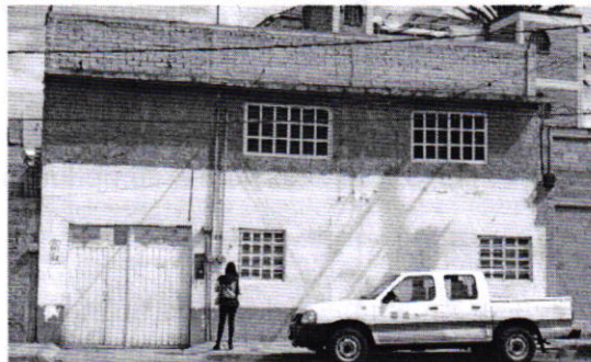
Figura 2. Lugar de los hechos denunciados.

En seguimiento a la denuncia, personal de esta Entidad realizó una nueva visita de reconocimiento de hechos, diligencia durante la cual una persona habitante del lugar donde se denunciaron los hechos objeto de la presente investigación, hizo de conocimiento al personal adscrito a esta Subprocuraduría que el ejemplar canino que fue señalado en el escrito de la denuncia, ya no se encuentra en el inmueble, lo anterior toda vez que las personas que habitaban dicha vivienda dejaron de arrendar la misma, llevándose consigo a su animal de compañía. Cabe señalar que el personal de la PAOT constató que efectivamente no había algún ejemplar con las características descritas en la denuncia al exterior del domicilio en cuestión.