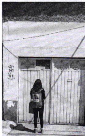
Figura 1. Lugar de los hechos denunciados.

En este sentido, de las constancias que obran en el presente expediente, se desprende que personal de esta Procuraduría llevó a cabo una visita de reconocimiento de hechos, de acuerdo a lo establecido en el artículo 15 BIS 4 fracción IV de la Ley Orgánica de esta Entidad, diligencia durante la cual desde el espacio público no se constató la existencia del ejemplar canino motivo de denuncia; no obstante, procedimos a fijar en la puerta del inmueble en comento, mediante instructivo el oficio PAOT-05-300/200-243-2021.