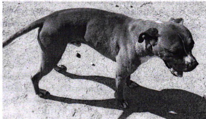
Fotografía 1. Vista del ejemplar canino que responde al nombre de "Flash"