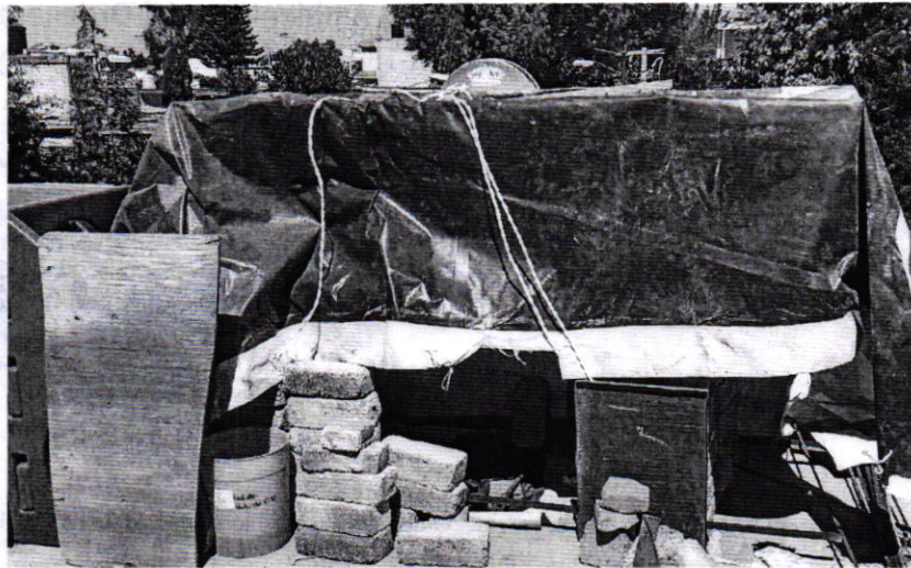
Fotografía 2. Sitio de alojamiento del ejemplar canino motivo de denuncia.

Por lo antes referido y toda vez que el ejemplar canino no contaba con un sitio de alojamiento, en seguimiento a la denuncia, personal de esta Entidad realizó otra visita de reconocimiento de hechos, durante la cual se constató que derivado del cumplimiento voluntario por parte de la persona propietaria del animal de compañía, se llevó a cabo el acondicionamiento del sitio de resguardo, con tablas de madera y cubierto por lonas, el cual le permite protegerse de las inclemencias del tiempo.