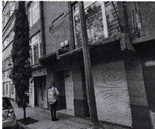
Figura 1. Lugar de los hechos denunciados.

En este sentido, de las constancias que obran en el presente expediente, se desprende que personal de esta Subprocuraduría llevó a cabo una visita de reconocimiento de hechos, de acuerdo a lo establecido en el artículo 15 BIS 4 fracción IV de la Ley Orgánica de esta Entidad, diligencia durante la cual nos constituimos sobre la vía pública, frente al lugar donde se denunciaron los hechos objeto de la presente investigación, asimismo tuvimos comunicación vía llamada telefónica con la persona denunciante, quien informó que el ejemplar canino motivo de denuncia ya no se encontraba en el domicilio en cuestión.