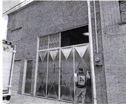
Figura 1. Vista del establecimiento mercantil motivo de denuncia.

En este sentido, de las constancias que obran en el presente expediente, se desprende que personal de esta Procuraduría llevó a cabo una visita de reconocimiento de hechos, de acuerdo a lo establecido en el artículo 15 BIS 4 fracción IV de la Ley Orgánica de esta Entidad, diligencia durante la cual desde el espacio público se observó que el establecimiento mercantil motivo de denuncia se encontraba en funcionamiento; sin embargo, no se constató la generación de emisiones sonoras por el funcionamiento de maquinaria que fueran susceptibles de medición acústica.