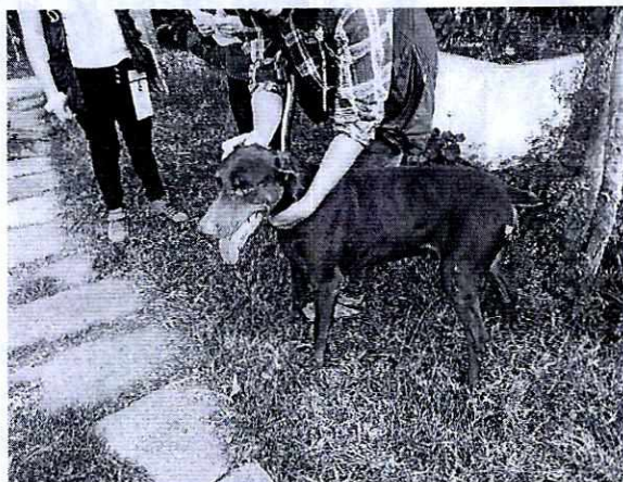
Fotografía 5. Se observa al ejemplar canino de raza dóberman color café.

La presente resolución, únicamente se circunscribe al análisis de los hechos admitidos para la investigación y al estudio de los documentos que integran el expediente en el que se actúa, por lo que el resultado de la misma se emite en su contexto, independientemente de los procedimientos que substancien otras autoridades en el ámbito de sus respectivas competencias.