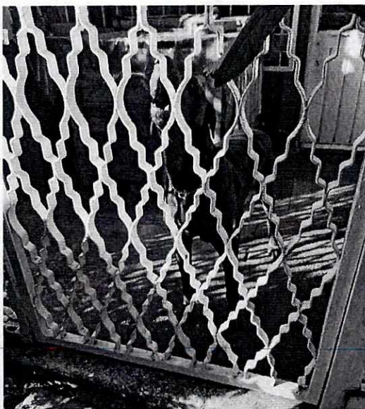
Fotografía 2. Se observa al ejemplar canino al interior del domicilio.