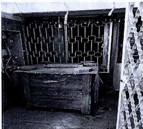
Fotografía 4. Se observa una casa de madera, lugar de alojamiento del canino.