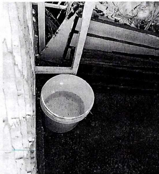
Fotografía 3. Se aprecia un recipiente de plástico con agua limpia a disposición del canino.

En virtud de lo antes expuesto, esta Entidad considera procedente emitir la presente resolución de conformidad con el artículo 27 fracción VI de la Ley Orgánica de esta Procuraduría, por imposibilidad legal, al no constatar irregularidades en materia de bienestar animal.