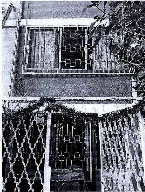
Fotografía 1. Se observa la fachada del domicilio señalado en el escrito de denuncia.

Alcaldía Iztacalco, debido a que presuntamente no cuenta con el espacio idóneo para resguardarse de las inclemencias del tiempo.